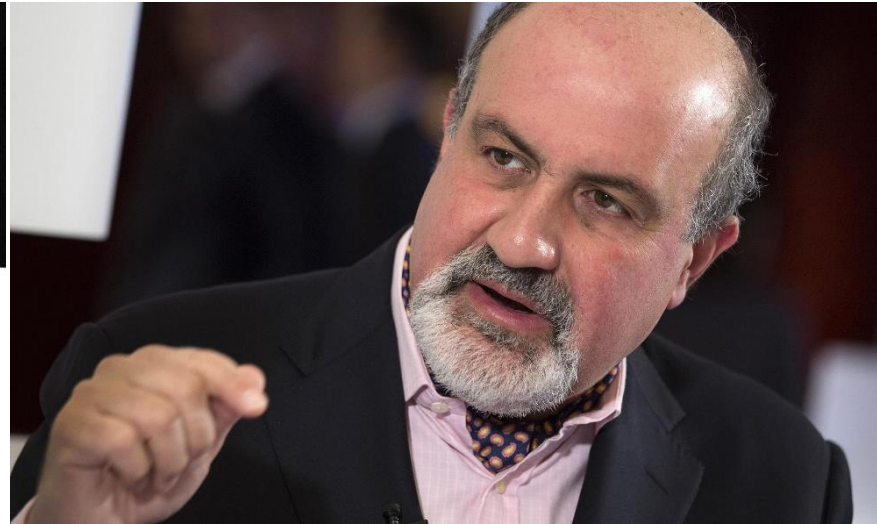
Нассим Николас Талеб